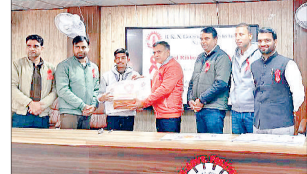
नारनौल। विजेता प्रतिभागियों को सम्मानित करते हुए।

रेड रिबन क्लब के सहयोग से मंगलवार को बाबा खेतानाथ गवर्नमेंट पॉलिटेक्निक में एचआईवी/एड्स विषय पर पोस्टर मेकिंग प्रतियोगिता का आयोजन किया गया। इस प्रतियोगिता का मुख्य उद्देश्य विद्यार्थियों में एचआईवी/एड्स के प्रति जागरूकता बढ़ाना तथा समाज में इसके प्रति सकारात्मक सोच और सही जानकारी का प्रसार करना था। प्रतियोगिता में विभिन्न शाखाओं के विद्यार्थियों ने बढ़-चढ़कर भाग लिया और अपने पोस्टरों के माध्यम से एचआईवी/एड्स से बचाव, जागरूकता, भेदभाव समाप्त करने तथा सुरक्षित जीवनशैली का संदेश दिया। विद्यार्थियों की रचनात्मकता