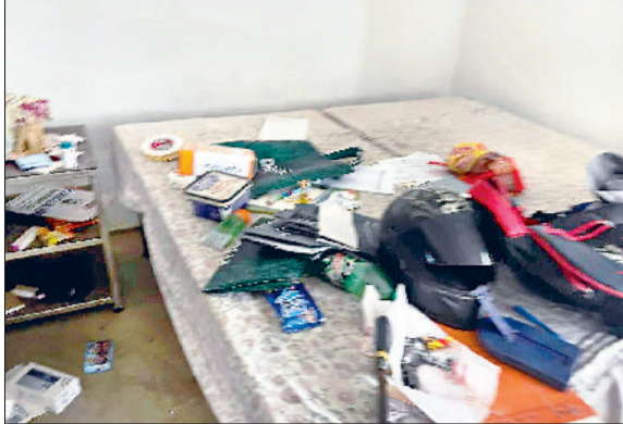
नारनौल। परशुराम कॉलोनी के मकान में चोरी द्वारा बिखरा गया सामान।

■ सोमवार दोपहर और शाम को चोरों ने दिया वारदात का अंजाम हरिभूमि न्यूज नारनौल