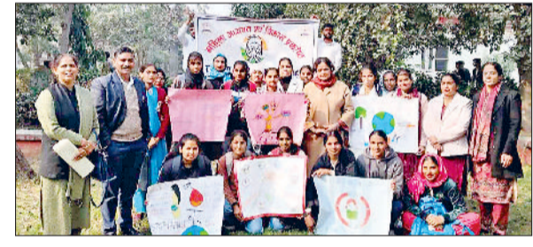
महेंद्रगढ़। प्रतियोगिता में बनाए हुए पोस्टर दिखाती छात्राएं।