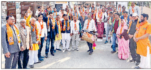
नारनौल। खुशी जताते भाजपा कार्यकर्ता।

शंकराचार्य जी जैसे उच्च कोटि के संत, जो करोड़ों सनातनियों की आस्था के केंद्र हैं, उनके साथ इस प्रकार का व्यवहार निंदनीय है।