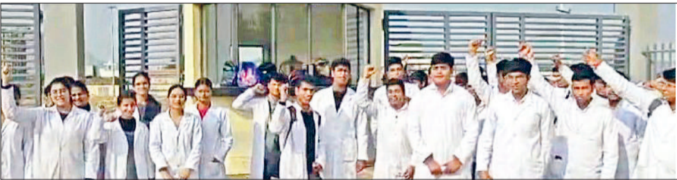
नारनौल। मेडिकल कॉलेज के गेट पर प्रदर्शन करते छात्र।

मेडिकल कोरियावास को इस नए सत्र से मिली है एमबीबीएस की 100 सीटें टीचर्स एवं अन्य सुविधाएं नहीं मिलने से छात्रों को हो रही परेशानी