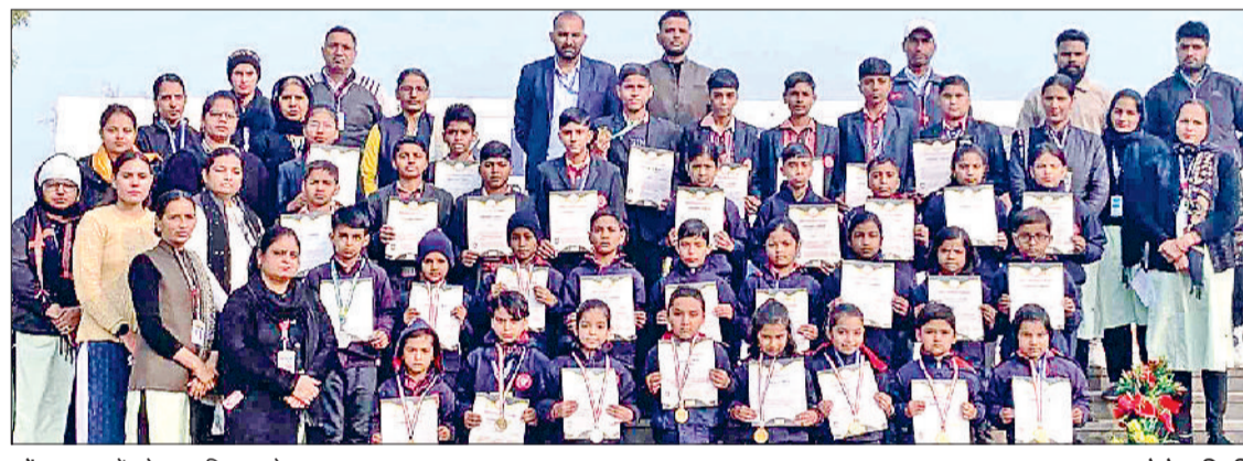
महेंद्रगढ़। बच्चों को सम्मानित करते हुए।