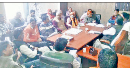
महेन्द्रगढ़। नगर पालिका कार्यालय में बैठक करते पार्षद व चेयरमैन।

नगर पालिका की बैठक मंगलवार को नगर पालिका कार्यालय में आयोजित की गई। बैठक में प्रधान व कुछ पार्षदों के बीच जमकर हंगामा देखने को मिला। हंगामे के दौरान पार्षदों एक-दूसरे को तू-तड़ाक की नौबत आ गई। हंगामा बढ़ता देख सभी पार्षद मीटिंग से बाहर निकल गए और अधिकारी भी बाहर चले गए। कार्यालय में पार्षदों व प्रधान के बीच जमकर नोक-झोंक देखने को मिली। दोपहर करीब 12 बजे आयोजित हुई बैठक में आठ प्रस्ताव रखे गए, जिनमें छह प्रस्तावों पर सहमति मिल सकी। इसके बाद बैठक में हंगामा हो गया।