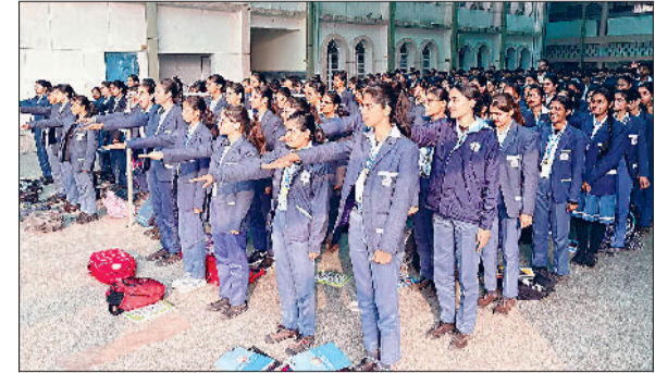
महेन्द्रगढ़। शपथ लेते विद्यार्थी।