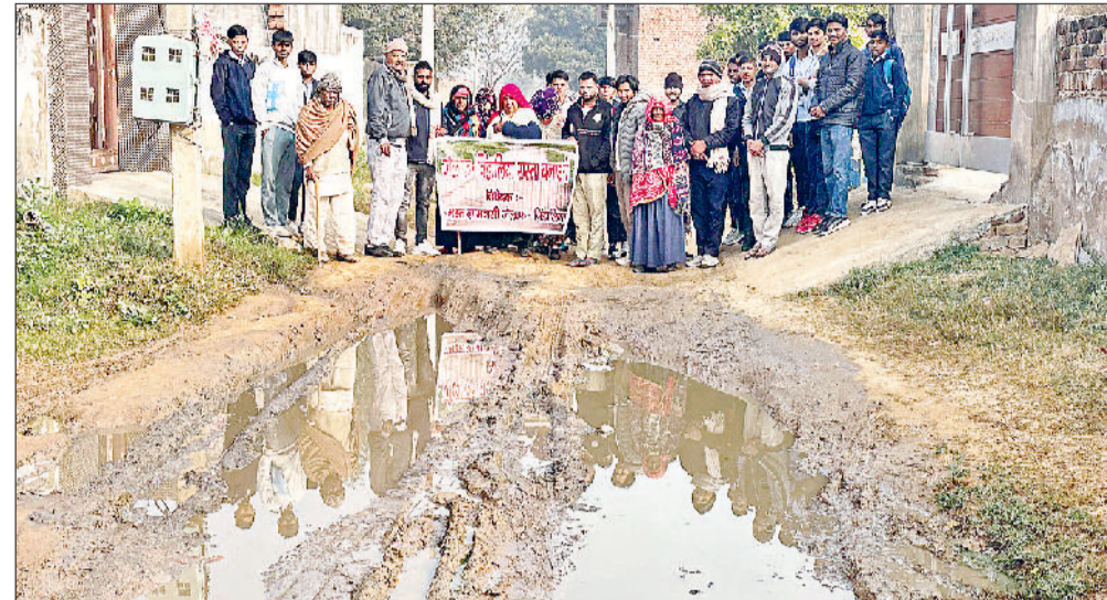
जगह-जगह पानी जमा होने के कारण ग्रामीणों, बुजुर्ग महिलाओं व स्कूली बच्चों का इस रास्ते से आवाजाही हो गई दुभार

ग्रामीणों ने जैलाफ गांव से चिंडालिया गांव को जाने वाले रास्ते को पक्का करने की मांग की है। रास्ते में आए दिन गिरकर चोटिल होने की घटनाओं से परेशान होकर ग्रामीणों ने जैलाफ से चिंडालिया रास्ता पर प्रदर्शन किया। प्रदर्शन में इस रास्ते से गिरकर घायल बुजुर्ग महिला चोटिल हाथों से जैलाफ से चिंडालिया रास्ता पक्का करो की आवाज बुलंद की। इस प्रदर्शन में इस रास्ते में आवाजाही से गिरकर घायल हुई बुजुर्ग महिलाएं, बच्चों, बुजुर्ग व महिलाओं ने मुखर होकर दां गांवों के लिए इस महत्वपूर्ण रास्ते को तत्काल पक्का करने की मांग की।