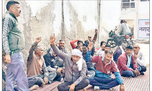
कनीना। नपा कार्यालय गेट पर धरना देते सफाई कर्मचारी।

नगर पालिका प्रशासन की ओर से पांच दिन पूर्व चलाए गए अतिक्रमण हटाओ अभियान के अंतर्गत कुछ दुकानदारों की ओर से नपा कर्मचारियों से झड़प करने की घटना के बाद मंगलवार को आपसी सहमति से सुलहनामा हो गया। जिसके चलते कार्रवाई की मांग को लेकर हड़ताल पर बैठे नपा के सफाई कर्मचारी दोपहर बाद काम