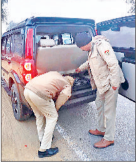
गाड़ी की जांच करते पुलिसकर्मियों।