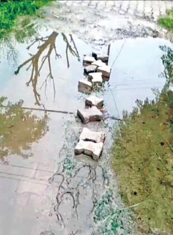
नारनौल। सड़क पर बहता गंद पानी।