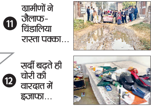
11 ग्रामीणों ने जैलाफ-चिंडालिया रास्ता पक्का...