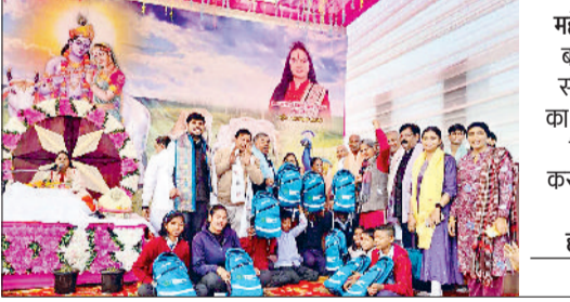
चराना एवं गोवर्धन पूजा का वर्णन किया तथा छपन भोग लगाकर सभी भक्तों ने परिक्रमा करके श्री गोवर्धन महाराज की पूजा अर्चना की। कथा के दौरान सिंगनेचर